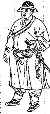
河州土指揮轄雲所轄珍珠族番民