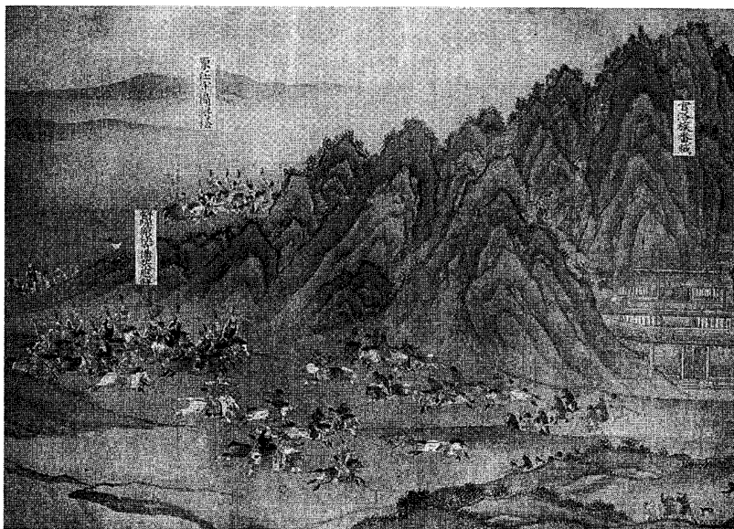
図二. 明軍（左）と西番（中央）の交戦