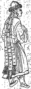
図一、河州のチベット系珍珠族