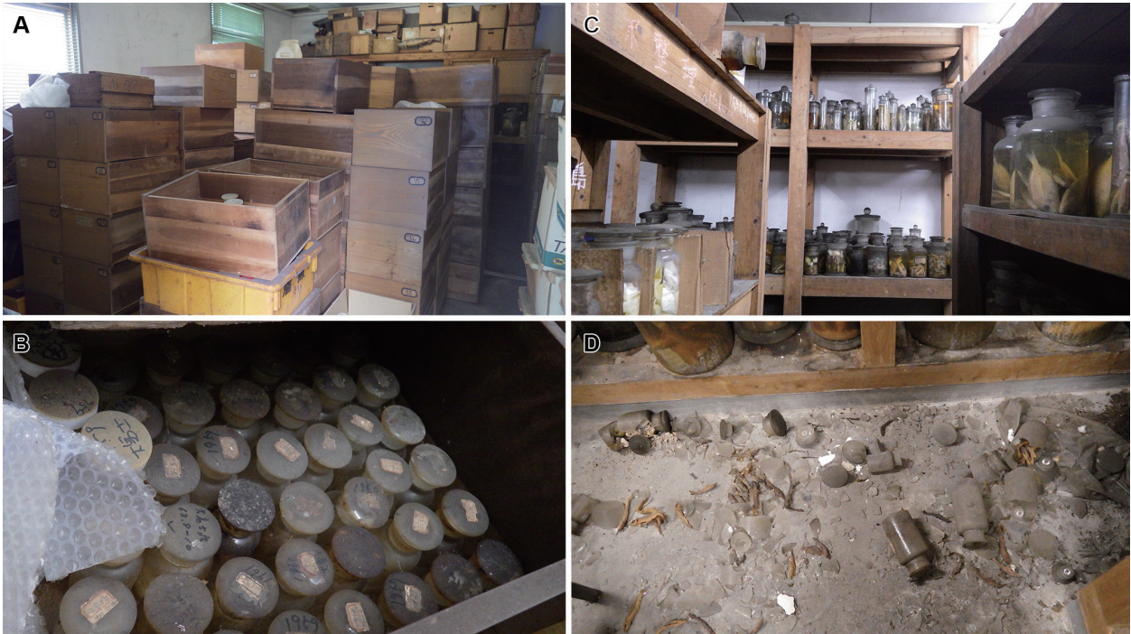
図5 レスキュー作業前の水産学標本室状況。木製単笥の引き出しが積み上げられた水産学標本室前室（2017年4月21日撮影）(A)；公庁船標本(B)；後室の標本は整頓された形跡があり、一部の棚はほぼそのまま保全されていた(C)；後室通路に落下した標本瓶と標本(D)。