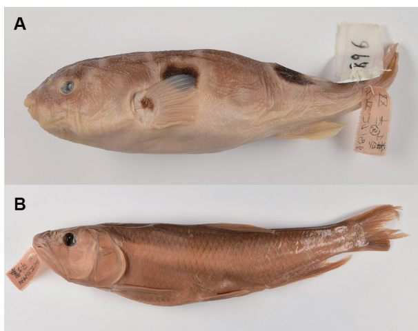
図1 1936年に平壤で採集されたメフグ(A)とコウライハス(B)。

生活史ステージ標本(内田コレクション)： 内田の朝鮮総督府赴任時代に収集された標本のうち、原則的には卵からの成長段階を追うようにして収集、整理された標本群である。元々は農学部3号館内田の教官室内の木製標本筆筒に収納されていたが、2008年に筆筒とともに箱崎サテライトに移動されている。多くは朝鮮半島で採集された淡水魚類であるが(内田(1939)に使われた標本を含む)、例えば山梨県で人工繁殖されていたサケ科魚類など、日本国内のものも少数含まれているほか、海産魚類も含まれる。なおこの箱崎サテライトに保管される一群は2008年の移動後に、瓶と管瓶への登録作業が行われた(UTD番号)。したがって、狭義にはこのUTD番号登録標本を内田恵太郎コレクションと呼称している( http://db.museum.kyushu-u.ac.jp/ichthyology/ )。基本的に標本は1942年以前に採集されたものであるが、非常に部分的にそれ以降の標本、すなわち天草富岡のトビウオ科受精卵(1951年)や、ニホンウナギの仔魚や組織標本(1954-1956年)のようなものも含まれた状態で整理されている。関連して、内田によるスケッチの原図(未公表のものを含