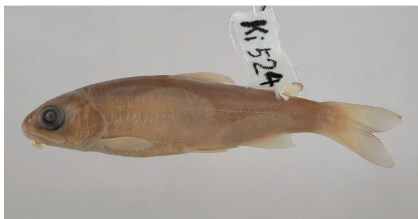
図4 再発見されたイワメ Oncorhynchus iwame のパラタイプ (Ki-524)。