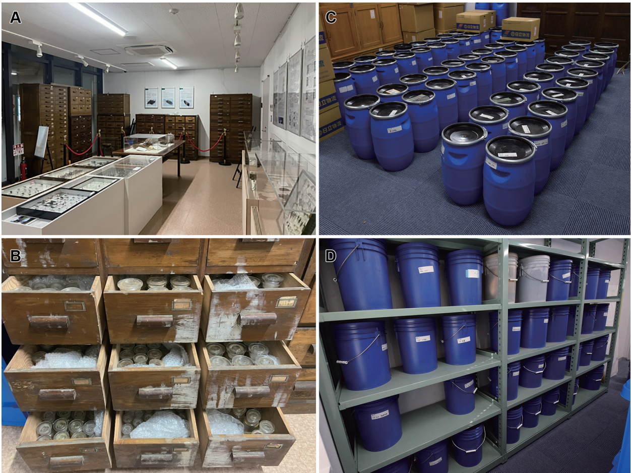
図6 伊都キャンパス農学部ウエスト5号館での標本保管状況。219室(A, B)；455室(C)；655-656室(D)。