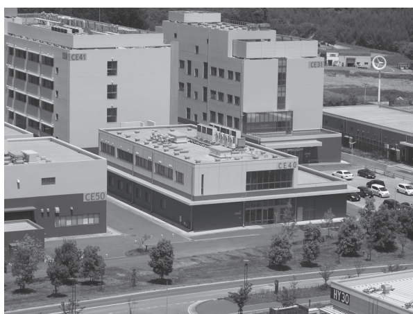
附属環境工学研究教育センター（CE40棟）外

2008年4月より10年間活動を行っておりました旧工学研究院附属循環型社会システム工学研究センター（旧附属循環センター）が改組され、2018年4月に「工学研究院附属環境工学研究教育センター」（附属環境センター）が誕生しました。旧附属循環センターでは、工学循環型社会・環境共生型社会実現の為の技術開発、アジア地域の環境保全に資する研究活動が推進されてきましたが、新しく生まれ変わった附属環境センターでは、これまでの研究活動を増進するとともにアジア・アフリカ地区などにおける急速な環境変化に即応する研究活動実施のため、時限を付した研究テーマを掲げた研究ユニットから構成される柔軟な組織と致しました。また、新センターではセンター名に「教育」を掲げ、学内外の環境に関わる教育活動・啓発活動についても積極的に行い、専門家や研究者だけでなく一般市民も参画可能な研究教育活動を推進する事を目指します。