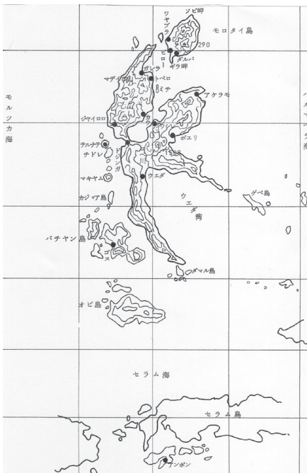
図3 ハルマヘラ島詳細図 (北隣のモロタイ島には連合軍の飛行場があった。)