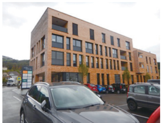
写真2 ヴァイラ村で2022年に新築された複合サービス建築物「ドルフミッテ (村の中心)」

ヴァイラ村の中心地は、隣接するクラウス村の領域内で住宅家屋がある場所とも至近距離にある。そこには ADEG という別のスーパーマーケットが立地している。金曜日の午前中のほぼ同じ時間帯に相前後して SPAR と ADEG の両方の店内を見学したところ、買い物客の人数が明らかに多かったのは SPAR だった。ヴァイラ村の中心部を通る道路は北に隣接するクラウス (Klaus) 村の中心部につながるヴァールガウ通り (Walgaustrasse) であり、この道路は南に隣接するレーティス (Röthis) 村、さらにその南のズルツ (Sulz) 村、そしてその南のランクヴァイル町の中心部につながっており、これらの町村の住宅家屋などはヴァールガウ通りとその延長であるミューズィネン通り (Müsinenstrasse) に沿ってほぼ連坦している。クラウス、レーティ