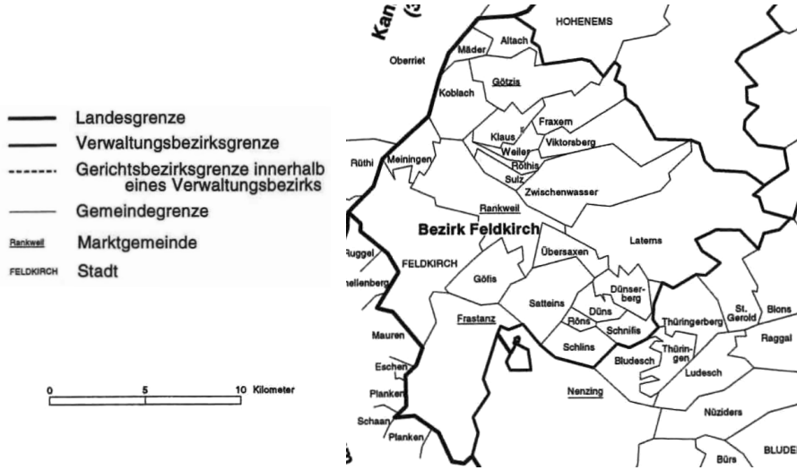
図2 ヴァイラ村とその近隣ゲマインデの位置関係

太線で囲まれているのはフェルトキルヒ県の範囲。フォルダラントはフェルトキルヒ市とその東 Göfis や Laterns などから北に向かって Klaus、Fraxen、Meiningen までの範囲にある13のゲマインデから構成される。