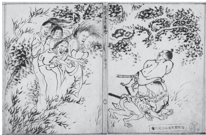
『筑前名所図会』／廣瀬文庫 中央図書館所蔵 奥村玉蘭によって著された福岡を代表する地誌であり、廣瀬文庫本は福岡市博物館所蔵稿本（奥村家本）より遡る稿本。この宗像郡「増福院・怨霊出現図」も奥村家本と描写が大きく異なる。

の古器物の展示、農業参考館の設置、筑紫化蝶会（古銭）や八雲会（和歌）の開催など、多様な社会教育事業を展開したが、館主廣瀬玄銀の死を契機として閉館した。福岡における近代図書館の原点といふべき蔵書が、附属図書館の基盤となったのである。廣瀬文庫は、寄託期間の延長を経て戦後に売買契約が成立し、九州大学の所有に帰した。蔵書構成は多岐にわたるが、なかでも九州・福岡の郷土資料に特色がある。