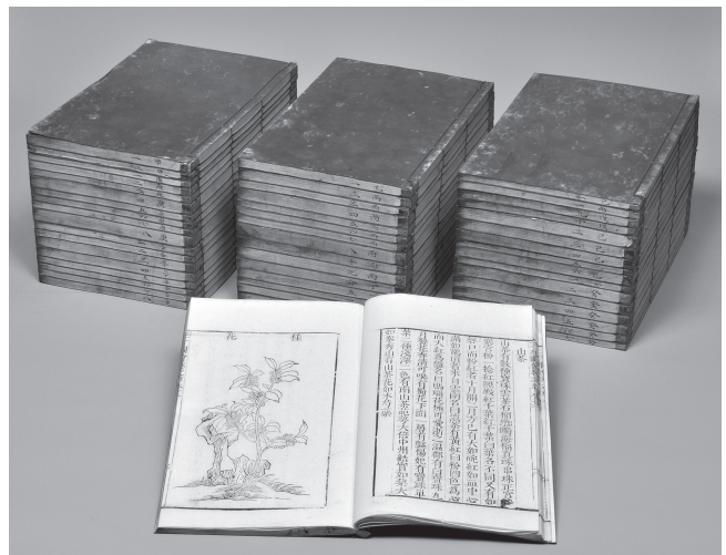
『三才図会』／眼科教室旧蔵狩野本 医学図書館所蔵 中国明代に編纂された絵入りの類書（今日の百科事典に類する）で、寺島良安『和漢三才図会』のモデルとなった。

九州帝国大学に附属図書館が創設される以前から存在した医学部・工学部・農学部においては、各教室で書物が蒐集・管理されたが、とりわけ医学部草創期の教授たちは、それぞれの学問の発展史を理解することを重視し、最新の文献だけではなく、和漢洋の古典文献を積極的に蒐集していた。明治末から大正期に、眼科教室初代教授大西克知が、教室を整備するにあたり、親交があった東京の狩野亨吉（近代日本を代表する思想家・教育家）より大量の書物を購入した。大西は、和漢の古医書だけでなく、類書・史書などの