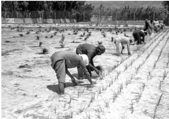
初夏の田植え。今年も無事収穫を迎えた。(2022年5月30日)