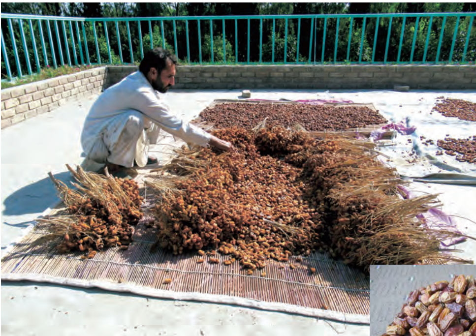
ガンバリ農場事務所で乾燥中のデーツ。今年は昨年より多く実がついたため、PMS職員たちに振る舞われる予定。皆今か今かと待ちわびている。（左2022年10月8日、右2022年10月12日）