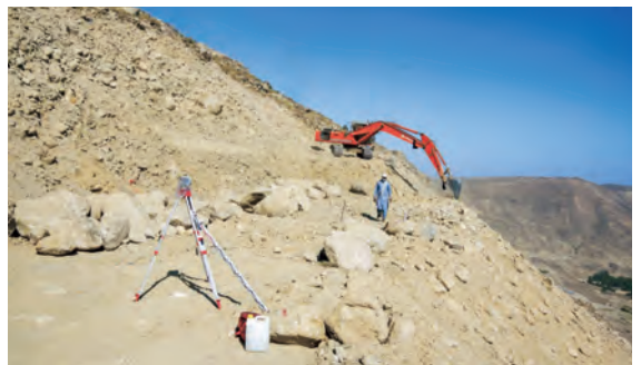
日本の技術支援チームからのアドバイスで、工事に先駆け地盤の支持力検査を行なった。堆積土からなる急勾配の崖地に水路を建設するため、安全面には最大限の注意が必要。(2022年9月20日)