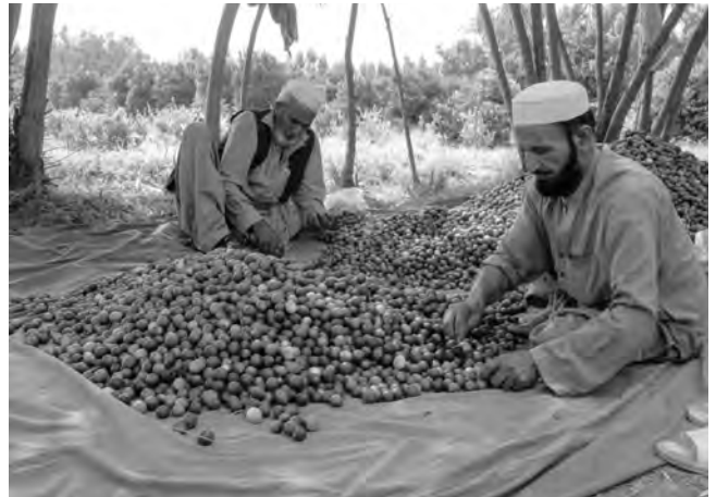
ガンベリ農場で収穫されたレモンの選別作業。(2022年9月27日)