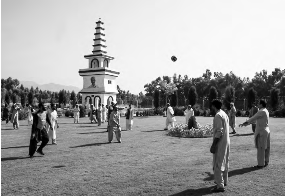
[写真] 9月15日のガンベリ記念公園

〈URL〉 http://www.peshawar-pms.com 〈E-mail〉 peshawar@kkh.biglobe.ne.jp