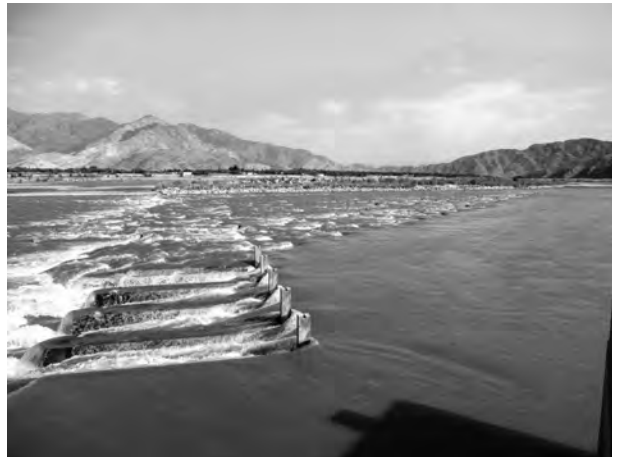
8月の大洪水で巨礫の移動が見られるが、機能を保っているバルカシコート堰。(2022年11月5日)

が押し寄せていましたが、今では感染疑いの症例は減少しています。政府によるワクチン接種が継続され、診療所の管轄 かんかつ 地域では全住民が接種したことが功を奏したと考えられます。