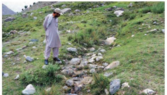
[左] コット川から下流の村まで引かれた既存の水路。これと同じ原理で、本計画では水量が増える夏季に川から取水する予定。[右] 年間を通して取水が見込まれる川沿い崖地の湧水。川と湧水からの取水によって、1本の用水路が引かれる。(2022年5月30日)