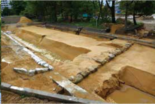
▲ 元寇防塁 発掘調査