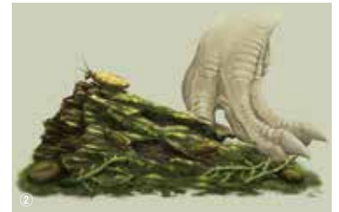
① ワークショップの様子 / ② 福井県のゴキブリ類化石たちの復元画。恐竜の足元に5種のゴキブリ類が隠れている(絵: ツク之助・監修: 大山望・今井拓哉・湯川弘一)

手取層群北谷層からもゴキブリ類化石5種が報告されました。福井県の北谷層からはこれまで数多くの恐竜化石が報告されており(例えば、フクイサウルス・テトリエンシス Fukuisaurus tetoriensis 、フクイラプトル・キタダニエンシス Fukuiraptor kitadaniensis など)、日本有数の恐竜化石産地として知られていましたが、実はその恐竜の足元には生態系を支える昆虫たちが多く生息していたことがわかりました。その他にも日本の中生代(三畳紀・ジュラ紀・白亜紀を含む時代)から少なくとも17地域の昆虫化石産地が知られています。これらの産地から発見されている昆虫化石の中には、まだ名前すらわかっていない昆虫化石が多く含まれています。さらに、新たな昆虫化石産地の開拓も進められており、今後日本独自の昆虫化石研究の発展が期待されます。皆さん博物館や化石採集に行かれる際は、恐竜やアンモナイトたちだけでなく、ぜひ昆虫化石に目を向けてみてください。想像以上に小さくて、でも美しい昆虫化石の魅力の虜になるはずです。