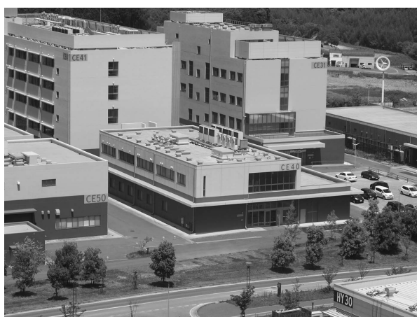
附属環境工学研究教育センター（CE40棟）外観

2008年4月より10年間活動を行ってまいりました旧工学研究院附属循環型社会システム工学研究センター（旧附属循環センター）が改組され、2018年4月に「工学研究院附属環境工学研究教育センター」（附属環境センター）が誕生しました。旧附属循環センターでは、工学循環型社会・環境共生型社会実現の為に技術開発、アジア地域の環境保全に資する研究活動が推進されてきましたが、新しく生まれ変わった附属環境センターでは、これまでの研究活動を増進するとともにアジア・アフリカ地区などにおける急速な環境変化に即応する研究活動実施のため、時限を付した研究テーマを掲げた研究ユニットから構成される柔軟な組織と致しました。また、新センターではセンター名に「教育」を掲げ、学内外の環境に関わる教育活動・啓発活動についても積極的に行い、専門家や研究者だけでなく一般市民も参画可能な研究教育活動を推進する事を目指します。