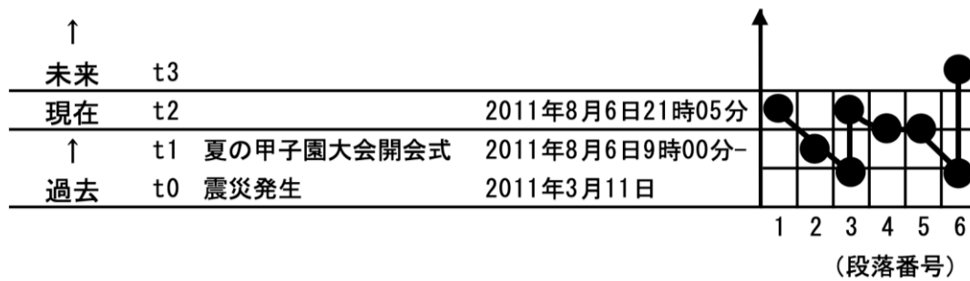
図3 ブログにおける2011年夏の甲子園開幕の物語の図式 アダン (2004) を参考に作成