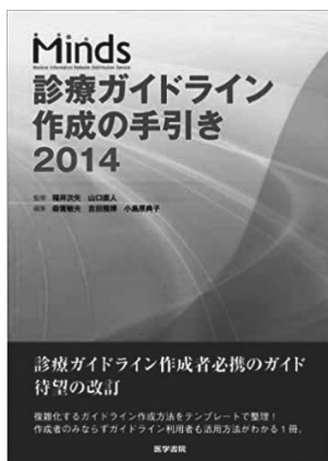
図1. Minds 診療ガイドライン作成の手引き 2014 3)

Minds: Medical Information Distribution Service 1) .