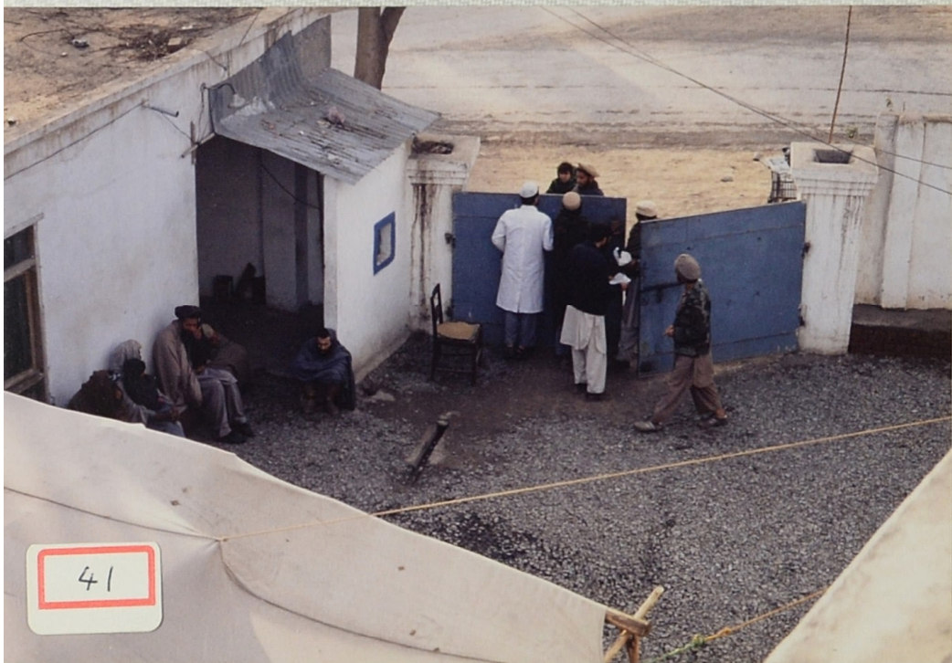
JAMSA 正内 患者の出入り の経路。