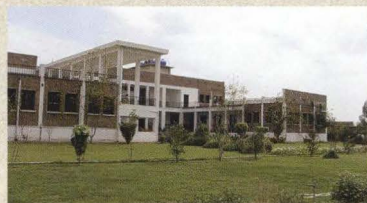
ペシャワール会医療サービス病院

ペシャワール会は、1983年9月、中村哲医師のパキスタンでの医療活動を支援する目的で結成され、会員の会費・寄付金を中心に運営されるNGOです。現在はパキスタンとアフガニスタンで、医療活動（本部病院と2つの診療所の運営）・水資源確保活動（1600本の井戸の掘削、全長30キロの農業用水路建設※17キロまで通水）・農業支援活動（実験農場でのサツマイモ、お茶などの栽培）を行っています。