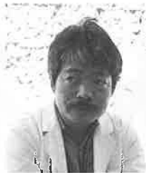
一九四六年福岡市生まれ。西南学院中学・福岡高校・九州大学医学部卒。一九八四年パキスタンのペシャワールに赴任。計画を柱にしたアフ

ガン難民の診療に携わりと共に一九八六年JAMS（日本アフガン・医療サービス）を設立、長期的展望に立ったアフガニスタン無医地区での診療モデルの創設をめざしつつ現在に至る。現在JAMSは一つの病院と四つの診療所を設置して、アフガン人の無料診療にあたっている。一九九四年十二月にはらい病院PLSを設立。著書に『ペシャワールにて』『ダラエ・ヌールへの道』（石風社）『アフガニスタンの診療所から』（筑摩書房）『ペシャワールからの報告』（河合文化研究所）がある。