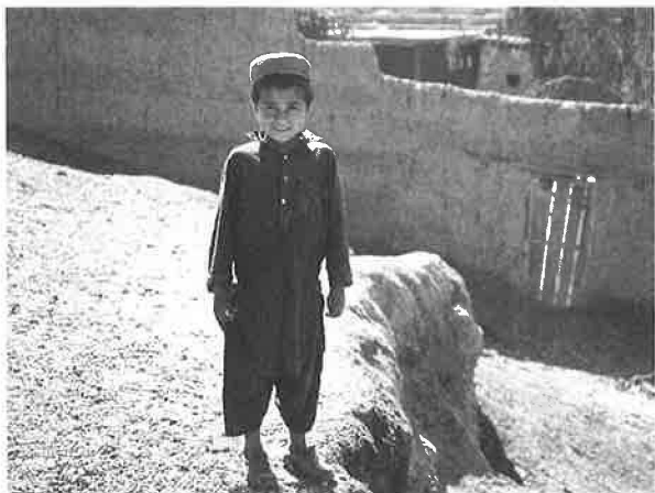
戦乱の中にあっても子供の笑顔は明るい

な平地に、あるいは山の斜面に張り付くようにして、人々の生の営みがあります。人が人としての生を全うするのに、さほど多くのものは必要としない。そんなふうにも感じられません。