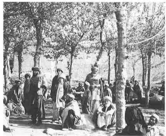
診療を待つ患者さんたち

私達の第一の目的であるアフガニスタンの奥地にドラエヌール診療所を訪れた時のことも忘れることは出来ません。診療所の建物には名古屋サウスライオンズクラブの協力に依って出来たものであると言う看板ががっちり掲げてあり、壁の厚さも八〇センチもあろうかと思われる石造りの建物は戦乱で荒れ果てた中に竜宮城の御殿のようでライオンズクラブの浄財が此所に活かされていることを確