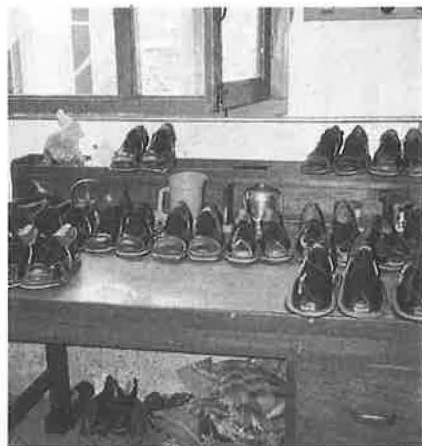
らいの治療用サンダル

てくるか、ヒントを頂きました。面白かったのは、接着剤や糸・金具などを売っている店に入ったとき、「日本からのお客さんと一緒に来ましたよ」と言ったら、そのお店の番頭格(?)のお兄さんが日本人イコール仏教徒と連想したのか、突然「私は仏教に興味があつて、知識もたくさんある」と言い出したのです。これまで来店しても領収書での品物のつき合せや値段の話ししかしたことがなかったの、「ええ?」ときき返したら、「実は自分はペシャワール大学で考古学の学士号を取得し、専門はガンダーラ仏教だ」との答えです。残念ながらこちらの仏教の知識が貧弱なため話はそれ以上進みませんでした。つい「でも今は靴の材料屋さんで働いているんですね」と言ってしまったら、彼曰く「食べるための