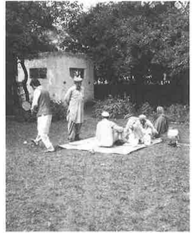
PLSの中庭でくつろぐ患者さん

この十カ月に百数十カ村を訪れて診療しており、ここ数年でクナール州とヌーリスタン地方の大部分の未治療患者たちを拾い出し、投薬態勢をもよりの診療所で確立します。