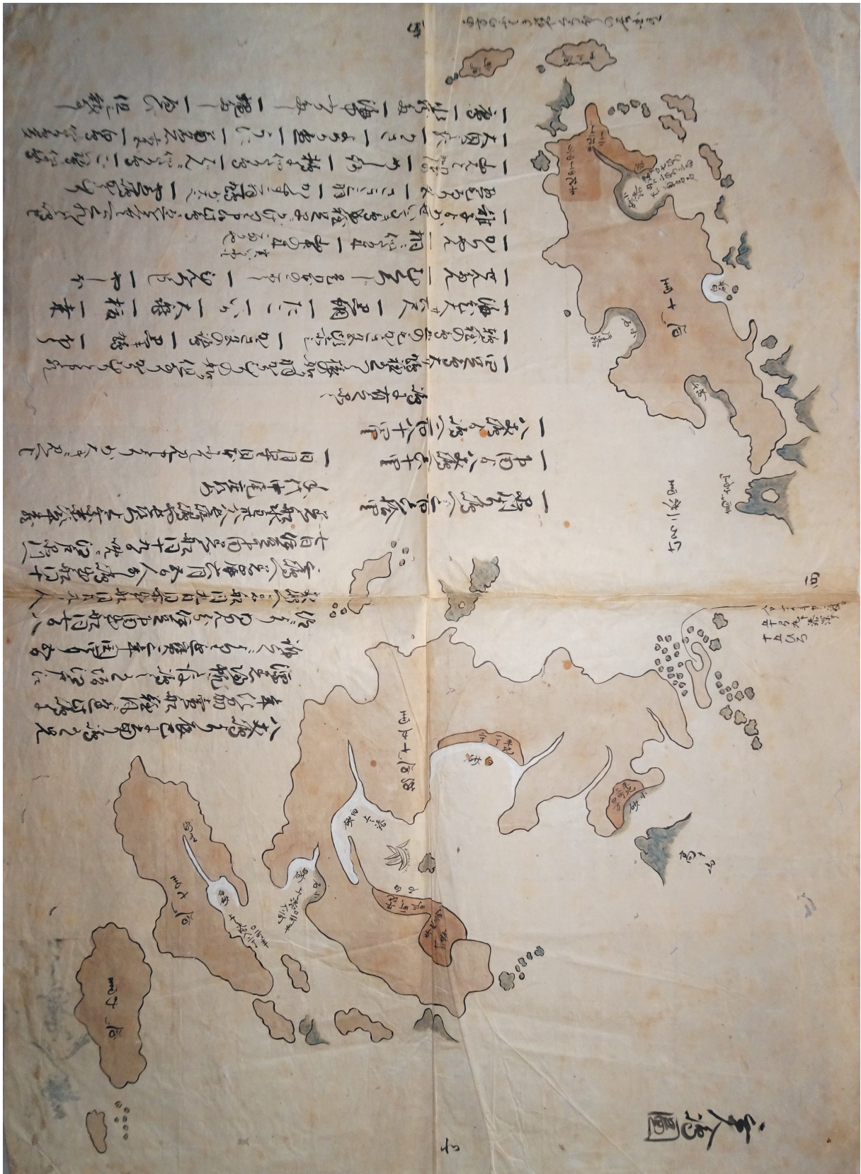
(写真1)「無人島之図」(全体)