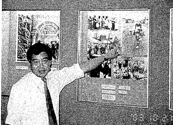
(三池の主婦の写真を展示。ドイツ鉱山博物館で)

はとっていません。外国炭は、入国時には国内炭より四〇〇ポンド(約八千八百円)安いのですが、大きな港が少なく、発電所まで小さな船便や陸上で輸送するので、二十五ポンド(約五百円)かかり、ほとんど産炭地に立地する発電所の炉前価格差がなくなり、外国炭と十分に太刀打ちできるそうです。 したがって、電力用としては外国炭は使わず、全電力源の七〇〇を国内炭が占めています。 しかし、電力会社はサッチャー政権の民営路線によって一九九〇年から民営化されるので、今後の引き取りに不安があり、政治の行方にかかっているとのこと。なお、鉄鋼用はすべて海外炭です。 政府の政策によって半数以上が閉山されましたが、セルビア炭鉱では五つのヤマを開発中で、来年一月に採掘開始となり金山が稼働すれば、一千百万トンを産出するヨーロッパの炭鉱となります。 ここは田園地区なので、景観をそこなわないように周辺を造園植林し、立坑着揚機などもしやれた建物の中にあり、これが炭鉱かと思ってしまうほど地域に溶け込んでいるように見えます。 産炭地・失業者対策は、B Cの関連会社が地方自治体と連携し、企業誘致、財政援助、離職者対策をしています。閉山になれば職業訓練校を設立し、技術取得後適性に合わせて他産業に就職させ、合わない人は再訓練して就職させるシステムです。 これらに要する政府の投資は年に六十億ポンド(約百三十二億円)。石炭産業への政府補助は八万八千二百萬ポンド(約千九百五十億円)で、主に赤字補助に使われています。