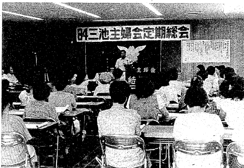
主婦、婦人労働者として頑張ろうと誓った総会