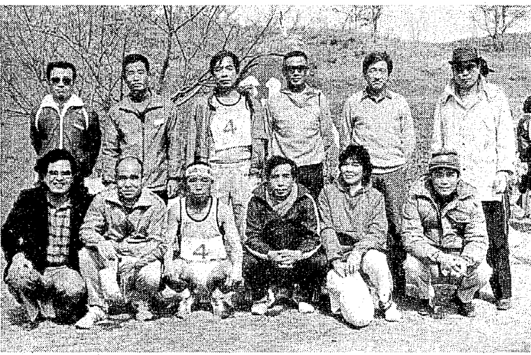
低気圧が停滞してぐずつき気味の天候がつづいていたが、この日は中1日だけの晴天に恵まれた。(三池労組チームの面々は、距離が短かくて走り甲斐がなかったとなかなかの強気だった)

若い人たちはばかりです。今の若い人は、と云うのではありませんが、私たちが目上の人には「はい」「いいえ」「そうです」と、必ず敬語で話します。ところがこの社員は、仕事の話でも責任者に「うん」とか、「違う」「よかもん」と言った具合です。どんなに仕事があっても、これでは幻滅を感じます。私は若い娘さんたちと働ながら、わが娘たちへのしつけの大切さを感じるとともに、私の高校時代はもっと大変だったでしょう、両親は愚痴一つ言わずに育ててくれたことに感謝しながら、娘二人の成長を羨しみに働いているのです。