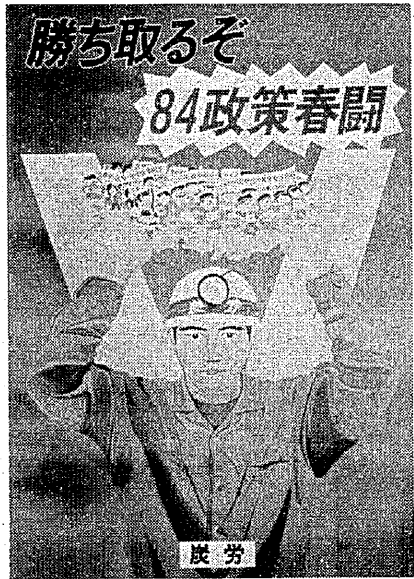
炭労の春闘ポスター

炭労第一〇五回臨時大会は三月十三、十四の二日間にかつた。炭労第一〇五回臨時大会は三月十三、十四の二日間にかつた。