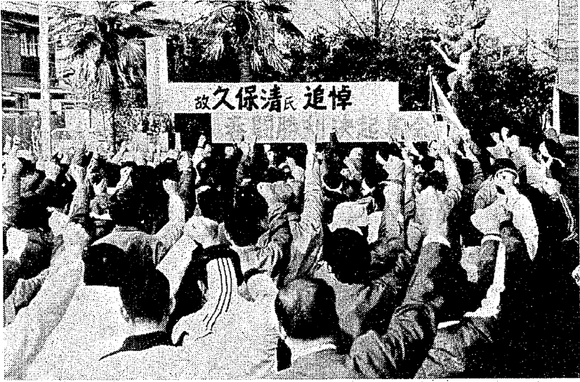
故久保清氏追悼春闘決起集会 (3月29日)