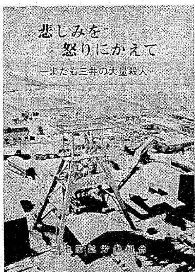
悲しみを怒りにかえて —またも三井の大量殺人—

発行 三池炭鉱労働組合 体裁 B5版 写真多数 四十二ページ 頒価 五百円(送料百七十円) ▼まもていただきますと送料は不要です。 ▼振り込みの場合は、福岡県労働金庫大牟田支店 二二八三九〇三〇三(三井)利用下さい。