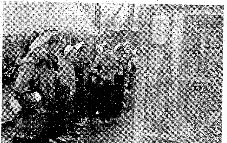
(右) 今日もピケ小屋に激励がつづく(三川鉱北門にて)