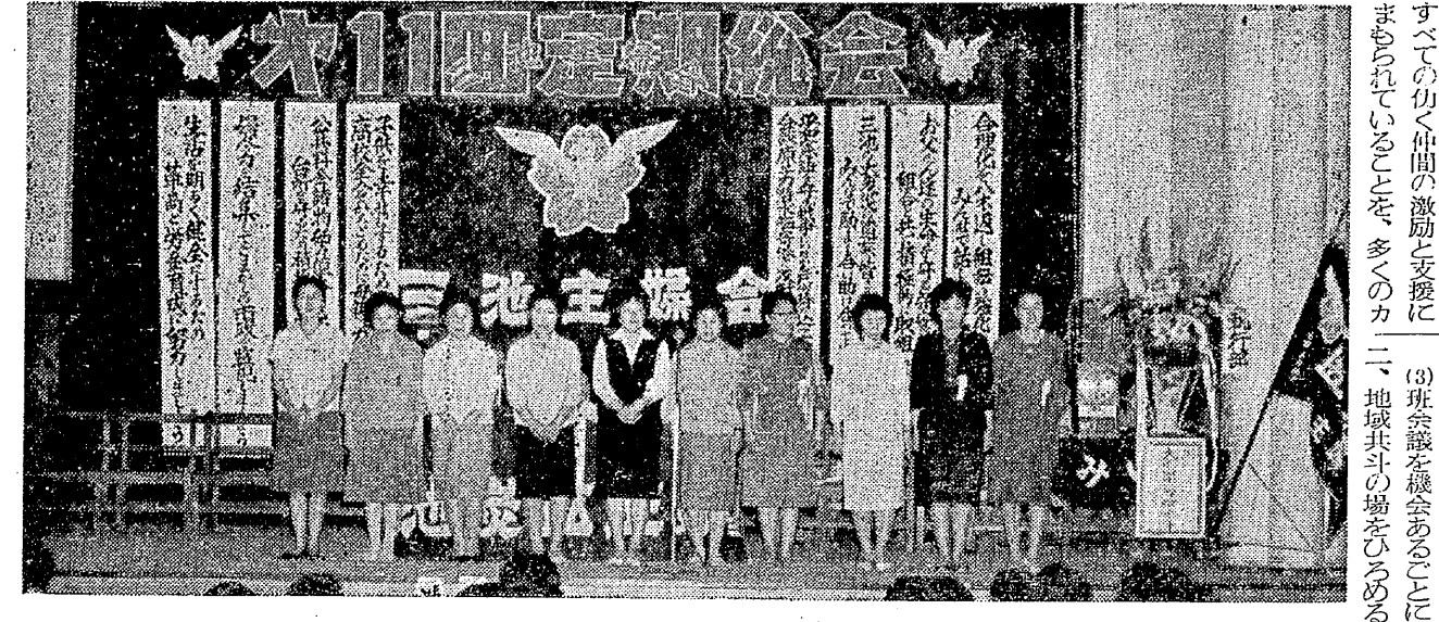
決定された1964年度本部役員全員