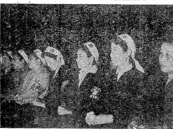
炭労大会で傍聴する主婦会代表

四月七日、おおせいの組合員や主婦会員が、各駅に赤旗を掲げ、三池の闘争を支援した。東京の各駅には、赤旗の波が押し寄せた。