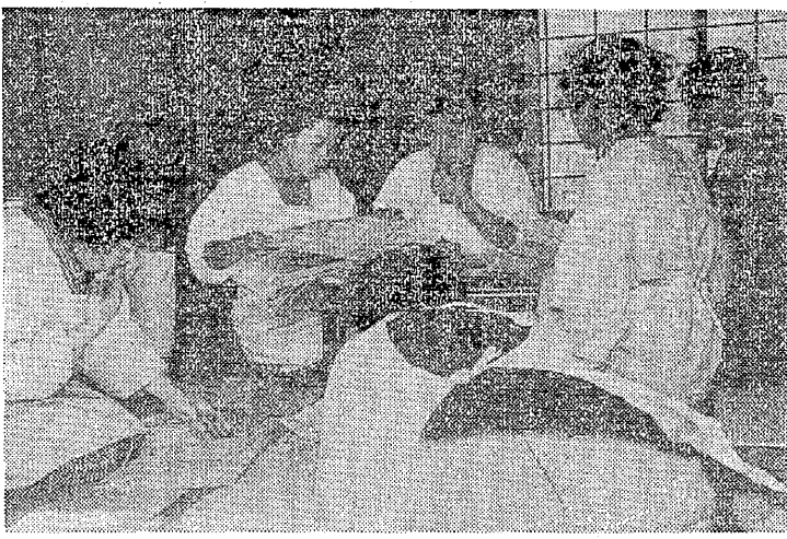
アンケート集約に大童の主婦会役員

「組織の強化はまず家庭の建設から」と昨年末、主婦会大谷分会では「夫たちは家庭を何をするか」のアンケートを出し、夫の意見や日々の生活の不満を聞き取り、それを整理して「一年活動報告」をまとめた。その結果、それを整理して「一年活動報告」をまとめた。その結果、それを整理して「一年活動報告」をまとめた。