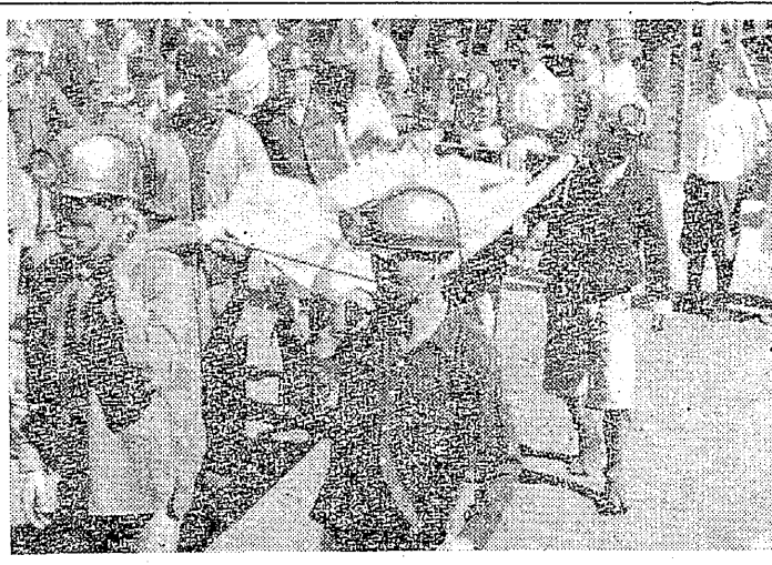
悲しき昇坑(三川鉄の變災)

三川鉄鋼製鉄所による保安設備の不足が原因で、保安のサボはないか！ 三川鉄鋼製鉄所(株)の保安設備の不足が原因で、保安のサボはないか！ 三川鉄鋼製鉄所(株)の保安設備の不足が原因で、保安のサボはないか！