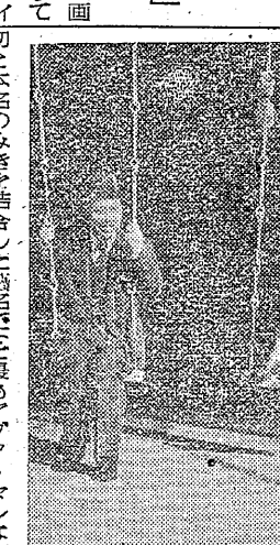
志村喬と小田切みき

東寶の大作『生』が上映された。この巨篇は、労働者の生活を描いた感動的な作品である。東寶の大作『生』が上映された。この巨篇は、労働者の生活を描いた感動的な作品である。