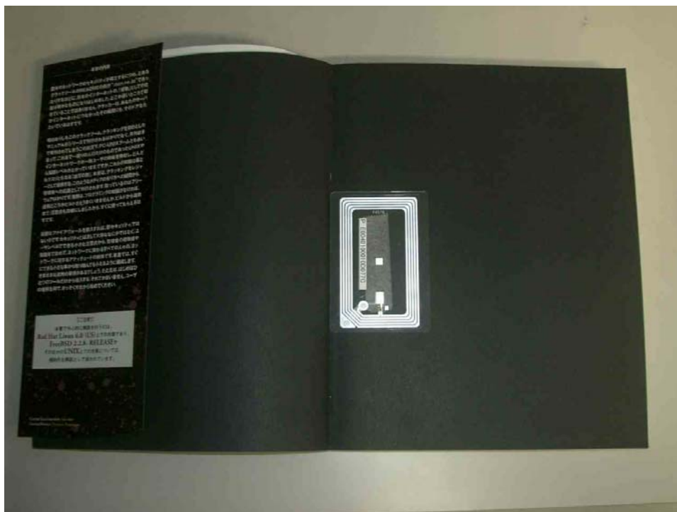
図 3: タグを貼付した場所。本を立てたときに右側にくるように貼付した

まず、通常の本架のように複数の本を配架した状態でのタグの読み取り精度について調べる。用いる本は30冊である。タグを貼る位置は、本の背を左にして置き、表紙または裏表紙をめくった右側のページで、背の部分に沿うように中央に配置した(図3参照)。この位置は筑紫分館に置けるタグの位置と基本的に同じである。