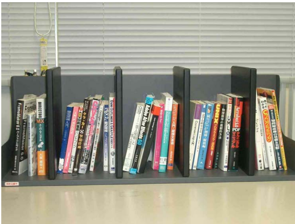
図 4: 複数タグの一括読み取り実験。多少傾いた本もあるが、基本的に自然に直立した状態で配架している

計測は10秒毎に計100回行い、30個全てのタグを100回とも問題なく読み取った。