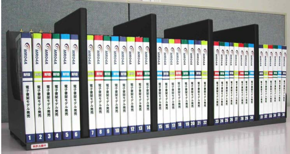
図 1: RFIDリーダー付き書架。サイズは900(W)×312(H)×290(D)である。 固定された4つのブックエンドがRFIDリーダーである

MR04Aはバラバラの方向を向いている数十個のタグを同時に読み取ることが可能であり、書架への応用も可能であると考えられた。書架の場合はトンネル型にすることは困難であるが、同社によると、コントロールユニットによる信号処理が重要であり、リーダーを組み込む形状はトンネル型である必要はない。