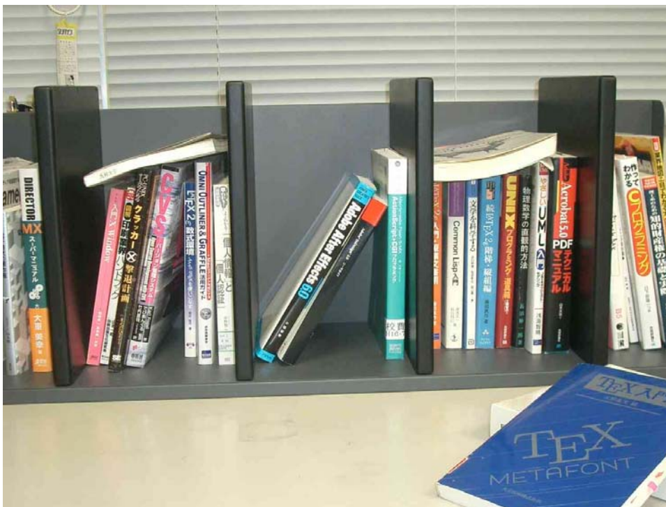
図 5: 複数タグの一括読み取り実験。2冊を横にした状態で配架、中央の2冊を極端に倒した状態で配架、さらに1冊を手前に置いている

次に、2冊の本を取りだし、これらを他の本の上に横にした状態で配架し、隙間のできた中央部分の2冊を極端に倒した状態で配架した(図5参照)。