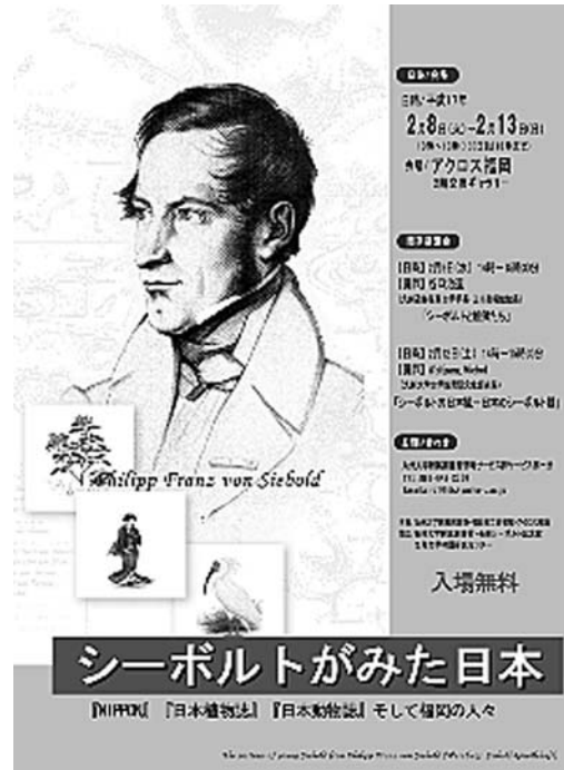
九州大学附属図書館作成のポスター

展示図版の選定、キャプションの作成、会場の展示レイアウトまで「展示会WG」メンバー