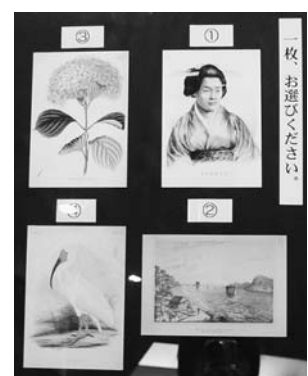
展示会用に作成した絵はがき