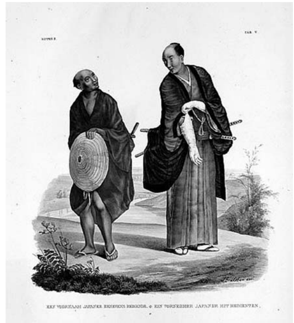
II-5e (128) 従者を連れた身分の高い日本人