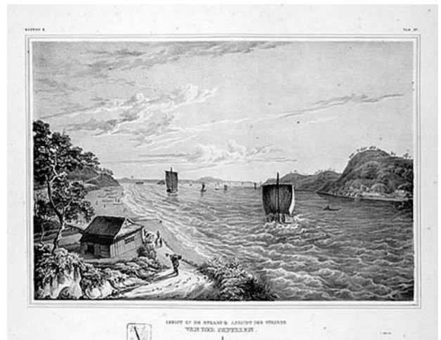
II-15d (102) 関門海峡の景

同じ図版が、県立図書館の蔵書では、従者の脚の片方が彩色されておらず、背景に九州大学蔵書にはない雲が描かれている。一口に初版と言っても、書誌学的見地から言えば、差異があることがこの図版を比較すると一目瞭然である。