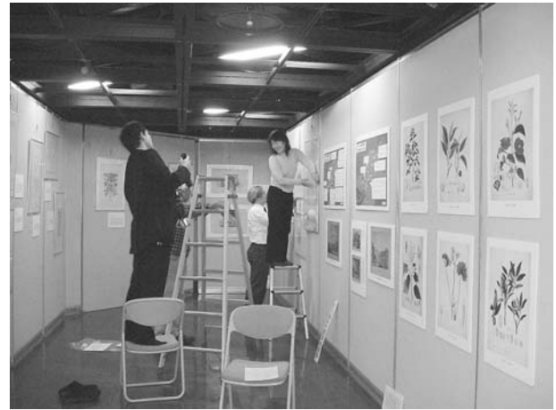
展示会場設営の様子

子供向けの企画として、簡単なクイズを用意し、回答者には、賞品として展示図版の絵はがきを用意した。また、記念スタンプを作成して、