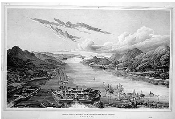
1-5b (12) 長崎港と湾の眺望

最後に、この展示会は、多忙な業務の合間を縫ってご協力いただいた多くの方々のお力添えで、無事終える事が出来た。このことを深く感謝し、結びの言葉としたい。