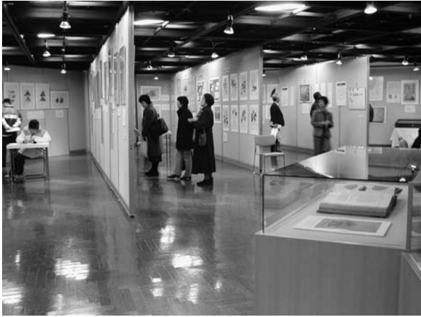
開催中の会場の様子