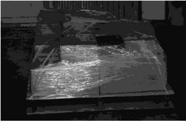
梱包され出荷を待つ図書