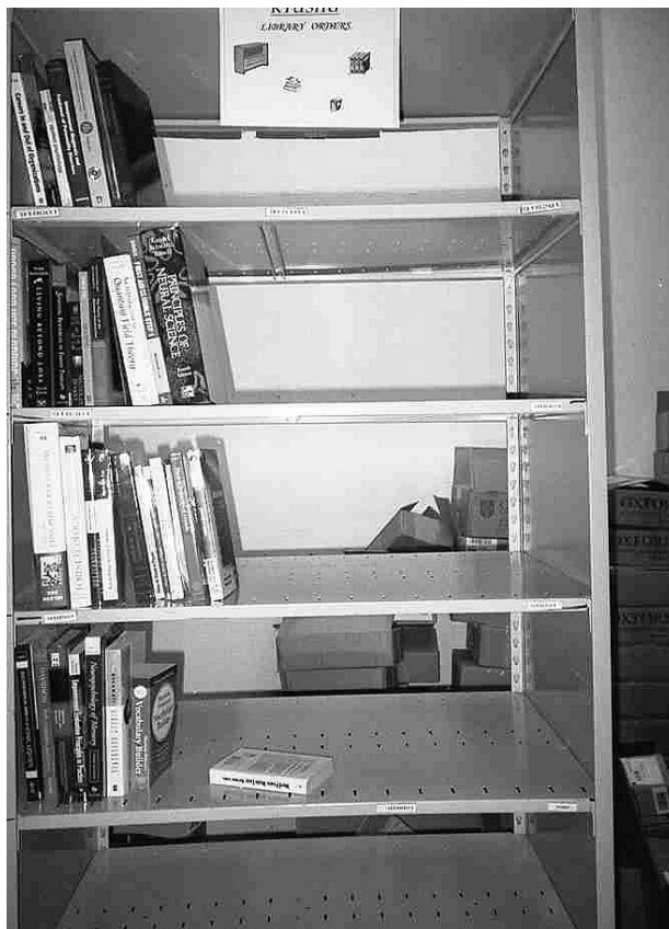
九州大学附属図書館専用の出荷棚

箱は日本への出荷の際にリサイクルして使用する。図書とパッキングリストを照合し、破れていないか、オーダー番号やタイトルは合っているかを確認して棚に並べられる。正式な価格は郵便で送られてくる請求書で確定する。九州大学附属図書館専用の出荷棚が用意されていた。