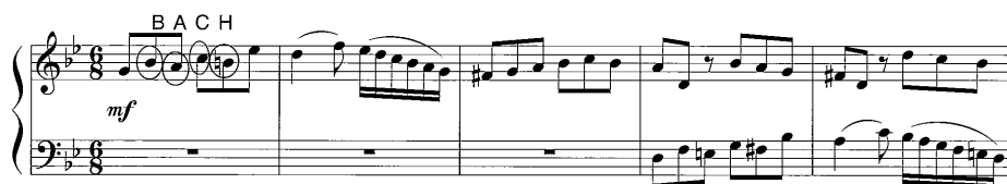
譜例8 Gigue における B-A-C-H