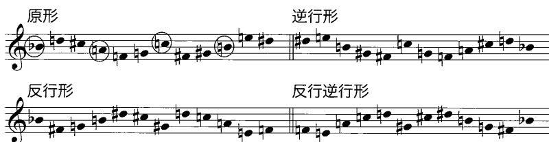
譜例9 基礎音列原形と3つの変化形

21 世紀の今日、時代を特徴づけるような音楽様式を見いだすことは困難である。あらゆる様式が混在している（ベニテズ 1981）。それ以前に、音楽や芸術と