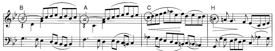
譜例 4 Courante における B-A-C-H