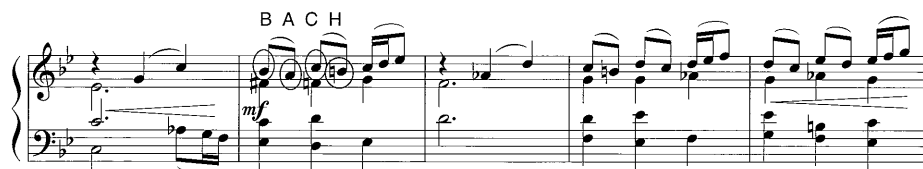
譜例7 Menuett における B-A-C-H