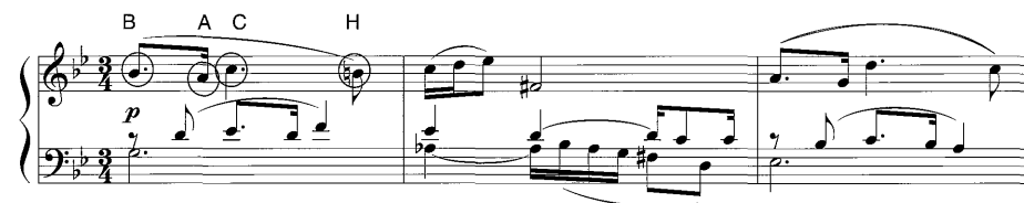
譜例 5 Sarabande における B-A-C-H