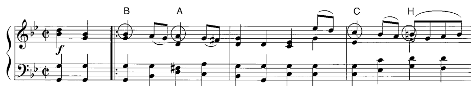
譜例6 Gavotte における B-A-C-H