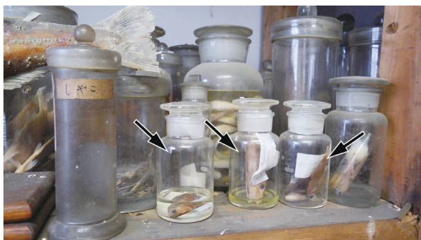
Fig. 2. Esaki's collection bottles in the Specimen Building of Fisheries when we found (arrows).

作に並べられていた。わずかに各1点が同標本室後室の棚（オオウナギ Anguilla marmorata ）と、農学部3号館6階の学生実験室の教壇下の戸棚（クモウツボ Echidna nebulosa ）から発見された。