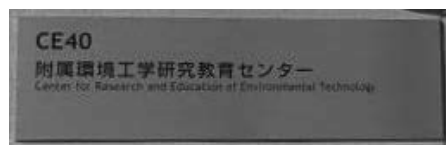
附属環境工学研究教育センター（CE40棟）外観