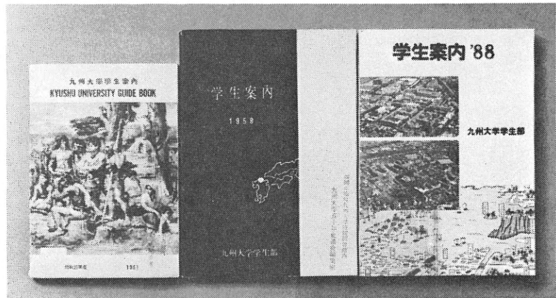
『学生案内』左より1951年、58年、88年。

しかし、「紛争」の影響も一段落した1974年（昭和49）には、「課外活動」中のサークル紹介が、学生側の提出するクラブ別の紹介記事から、学生部で調製する一覧表形式となって、『案内』の内容に大きな変更をもたらした。この結果、従来同書の主要部分を占めていたサークル紹介は、前年の37頁から8頁に圧縮され、全体的にも165頁から124頁と、約四分の三の分量になっている。