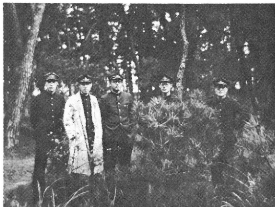
農芸化学仮校舎裏の松林（1935.10）

キャンパスは至極く静穏であった。時どき裏を通る湾鉄電車のレールを軋む鋭い音が響く他、騒音は全くない。湾鉄の海側は広い埋立地になっていた。防潮堤は現在の国道3号線か、もう少し先であったかも知れない。工事が終わったばかりと見え、処どころに水溜りのある、不毛の砂礫地であ