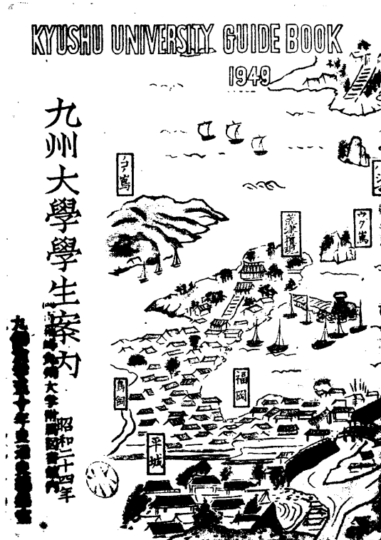
『九州大学学生案内 昭和二十四年』

この形の『案内』は、1953年(昭和28)頃から、各学部の紹介等に写真を多く取り入れるようになり、また1955年(昭和30)版からは、タイトルが『九州大学学生案内』から『学生案内』に改題されて、1957年(昭和32)まで刊行された。印刷状況が厳しかった昭和20年代を通じて刊行され続けた本学の刊行物は、この学生案内と、戦時中にも