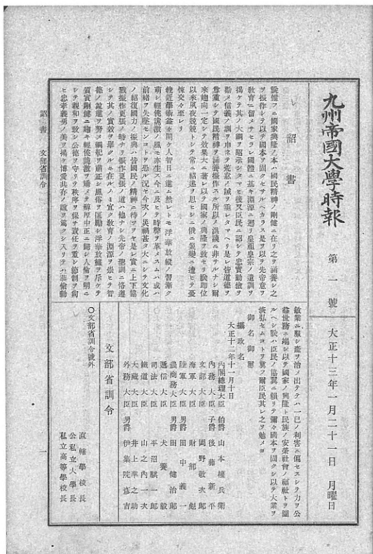
『九州帝国大学時報』第1号

印刷所はしばらくのあいだ工学部の製版室を利用することとし、1922年(大正11)3月までに準備を整え、4月から印刷の業務を開始した。当初の計画では、1921年(大正10)から1922年(大正12)の3か年で活版印刷器械等の器械を買い入れ完成を