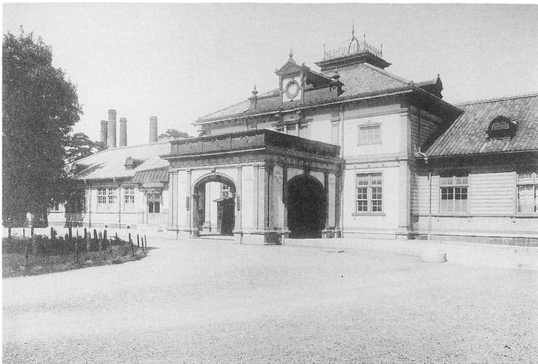
九州帝国大学附属医院入口

九州大学の附属病院は、1903年(明治36)4月、九州大学の前身である京都帝国大学福岡医科大学の創設に際して福岡県から寄付されたものである。1896年(明治29)福岡県立病院として建設されたもので、このとき福岡県から寄付されたのは、敷地2万9551坪、建物3262坪余、58棟であった。写真はその正面入口で、正門から入って右側、現在の歯学部附属病院の位置にあり、向かって右側が内科、左側が外科であった。昭和の初めに内科や外科が新しい建物に移転すると、歯科口腔外科学教室や医院事務室が一時これを利用していましたが、右側は歯科口腔外科学教室の建設予定地となって取り壊され、左側も1937年(昭和12)に現在の中央事務室が完成すると、医院事務室が移転して取り壊された。