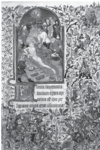
図版5 『聖ラウレンチウス』