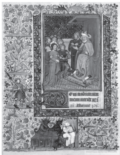
図版2 『ピラトの審問』 Rennes, Bibl. Métropole, ms. 34, f. 11 v.