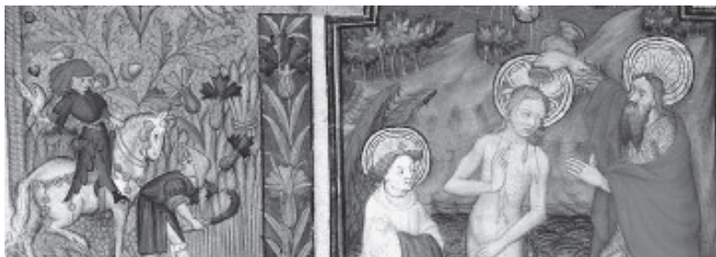
図版8 『キリストの洗礼』（部分） Paris, BnF, ms. lat. 1156 B, f. 161 v.