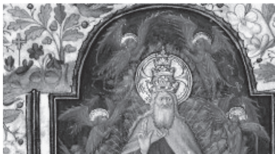
図版7 『神』（部分） Paris, BnF, ms. lat. 1156 B, f. 158 v.