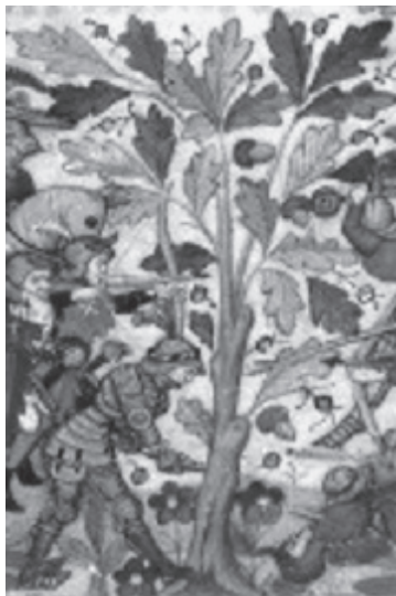
図版6 戦闘場面における櫛の木（部分） Paris, BnF, ms. lat. 1156 B, f. 171.