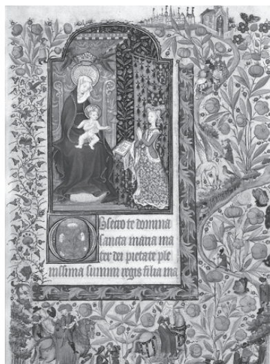
図版3 マルグリット・ドルレアンズの祈祷像 Paris, BnF, ms. lat. 1156 B, f. 25.