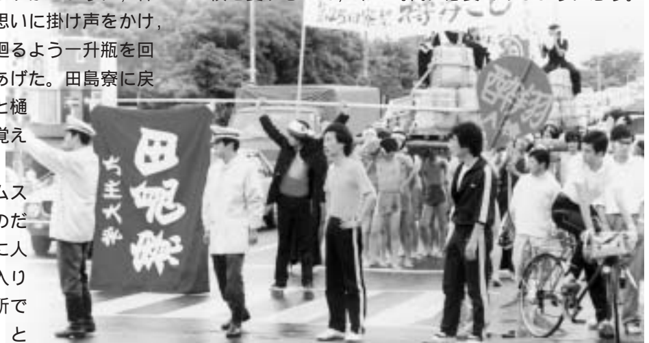
第25回 (昭和56年) 別府橋交差点 付近 行進コース 田島寮 — 六本松 — 大濠公園

私は, 現在, 九州大学松原寮同窓会の会長をしている。今年で23年目を迎えた同窓会には, 現松原寮生も含め300余名の会員が名を連ねている。寮をこよなく愛し, 寮生活が忘れられない者たちの任意集団である。今回, 田島寮があと数年で廃止されるというニュースを聞きつけ, いてもたってもいられず駆けつけた訳だが, 寮生の神輿を守ろうという志が伝わってきて嬉しかった。できれば, この田島寮のよき伝統を何とか残すことはできないだろうか。友を愛し, 寮を愛し, 母校を愛す心こそ, 今の時代に必要であるように思う。