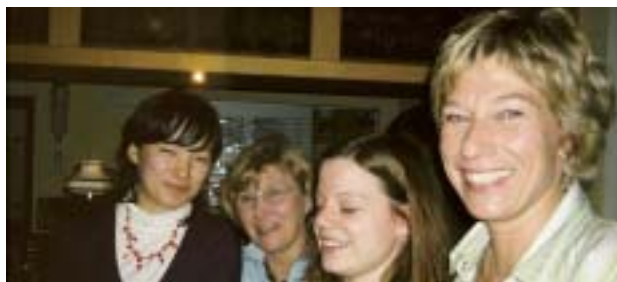
インターンシップ先の方々と

ここで、このドイツ・インターンシップ研修旅行について改めて簡単に説明しようと思う。中南ドイツの保養地として有名な Bad König に、一ヶ月間ホームステイをしながら、最初の一週間は午前中にドイツ語の語学授業を受け、午後は町の見学などを行い、残りの三週間はインターンシップをして過ごすという内容である。インターンシップ先は、自分で希望でき、仕事を体験することができる。日本ではなかなか簡単にはできない経験ではないだろうか。インターンシップ先の例を挙げるならば、幼稚園、パン屋、喫茶店、歯医者などある。ちなみに私は家庭用品の店で働いた。そこには、皿やコーヒーカップなどの食器だけでなく、蝋燭や花瓶、置物など家で飾るようなものも売っており、日々働きながら様々なものが見られて、楽しかった。在庫の確認や倉庫の整理から商品に値段を貼ったり、包装したり、店内の棚のディスプレイを考えたりと様々なことをさせてもらった。仕事の指示を聞き取ったり、質問したり、仕事の合間に日本のことやドイツのことなどを話したりした。初めは聞き取れる量も少なく、話し方もたどたどしかったのだが、次第に指