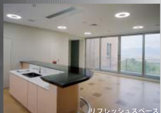
リフレッシュスペース