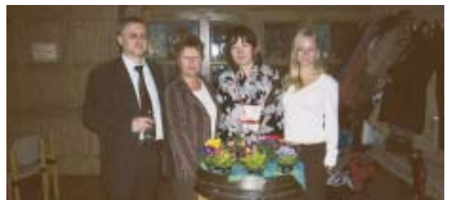
ホストファミリーと

このドイツ研修旅行で、周りの人々の温かさ、ドイツ人の素敵な心配りに触れることができて、感銘を受けた。日本における日常が当たり前ではない世界に足を踏み入れたことで、帰国後、視野が広がった感を受けた。コミュニケーションの大事さを、ドイツ語を通じて感じる事ができた。聞こう、分かって、話そうとする姿勢、目を見て話すことなど、言語以前のコミュニケーションが大事なのだと思った。この旅行で様々な糧を得たように思う。またいつか、ドイツを訪れてホストファミリーとインターンシップ先の人たちなどこの旅行で知り合った様々な人たちに会いに行きたい。