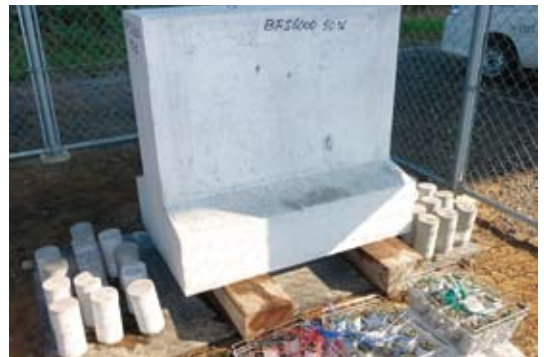
写真4 曝露試験用供試体の設置状況