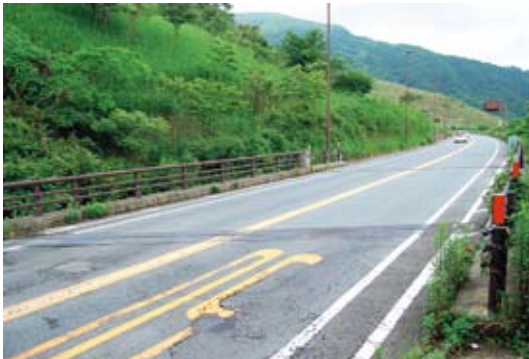
写真2 現在の放ヶ内橋 (写真中央のジョイントに挟まれた部分)

図1はコンクリート表面からの塩化物イオン濃度分布を示したものである。表面の領域で塩化物イオン濃度が高くなっていることから、冬季に凍結防止剤が散布されていることが裏づけられる。高炉スラグ微粉末6000を混和した配合（水結合材比35%）と従来の配合（水セメント比40%）を比較すると、スラグを混和した方が濃度が低く塩化物イオンの侵入が抑制されていることが分かる。Fickの拡散方程式の解に近似させた結果、見掛けの拡散係数は、スラグ無しが 0.11\text{cm}^2/\text{年} に対し、スラグ有りは約 1/5 の 0.020\text{cm}^2/\text{年} となり、両者の比は前述の既往結果と一致した。