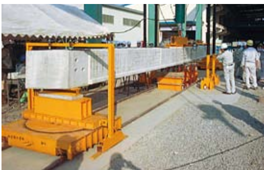
写真1 実規模 PC 桁の載荷実験状況

当時、初めて実構造物に適用されたのが、熊本県発注の俵山4号橋 4) であった（1999年12月竣