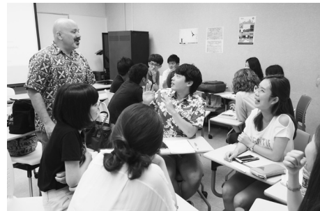
キャンパスハワイ 英語アカデミックプレゼンテーションクラス