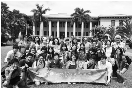
キャンパスハワイ 開講式