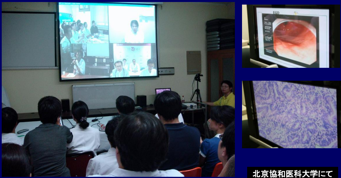
北京協和医科大学がリードする早期胃癌テレカンファレンスでは多くの病理画像を呈示。