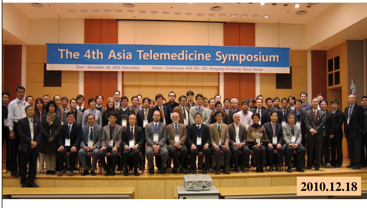
ソウルの漢陽大学で開催された第4回アジア遠隔医療会議の出席メンバー。