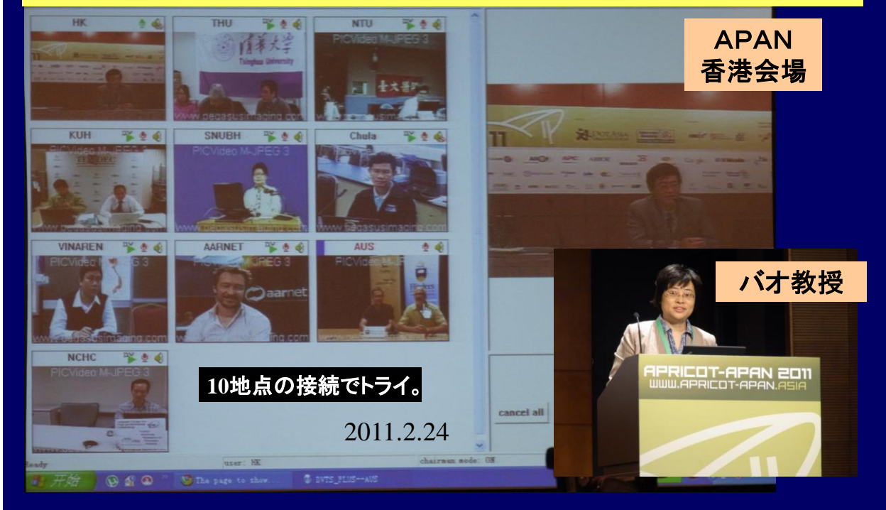
DVTS-Plus は再度 APAN で試され、10 会場で議論が交わされた。