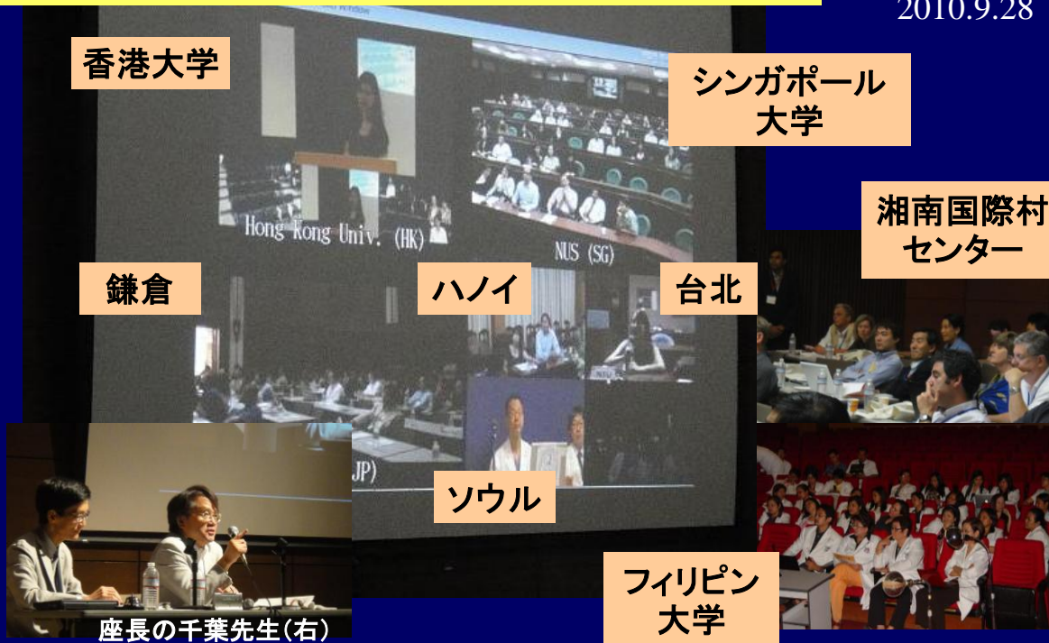
アジアで初めて開催された国際胎児学会で、テレカンファレンスを企画。