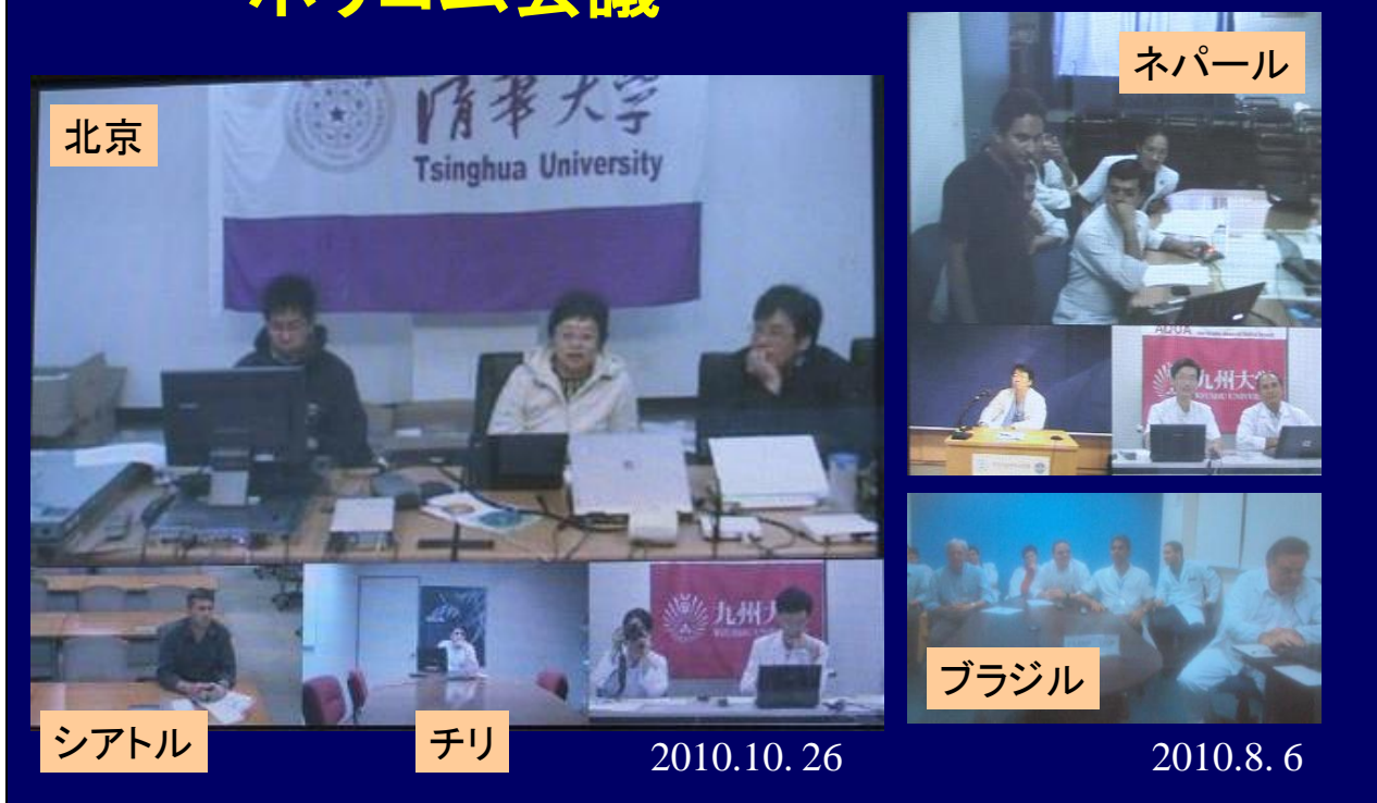
ポリコムなどの市販ビデオカンファレンスを使った会議も大幅に増加した。