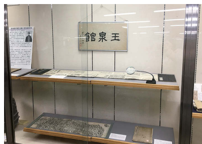
玉泉館の看板とともに

第一弾では、江戸時代の鏡、鐔、十手、藩札、その他に近代の軍票を取り上げました。第2弾では記録資料館九州文化史資料部門に保存されている江戸時代から明治期