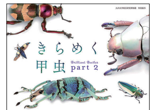
チラシ画像 デザイン：大村政之