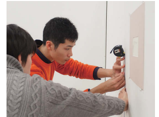
展示作業中の学生たち

今年度のAQAプロジェクトは、「九大百年 美術をめぐる物語」展の成果を踏まえ、九州大学所蔵品を用いて、