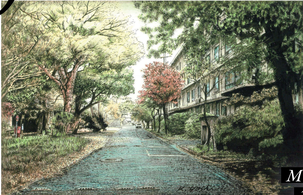
吉川幸作《工学部2号館裏通り》制作年不詳 九州大学大学文書館所蔵