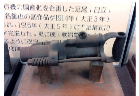
写真4) 足尾10 番型削岩機