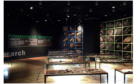
展示も手がけました：東大古生物学130年の軌跡

ただ、このような構想には、博物館の現状に鑑みると厳しいものがあります。ですが、災い転じて福となす。ガラガラポン。今をチャンスと捉え、他にはない九大モデルとして、大学の標本・資料情報を発信・創出する研究基盤の構築を目指します。