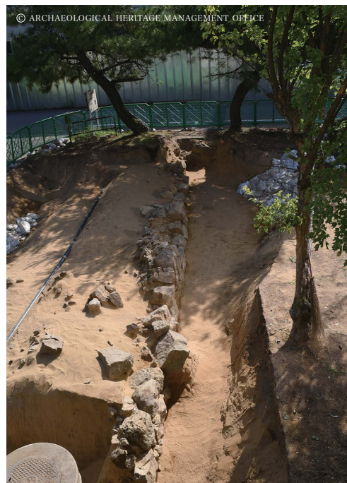
発見された元寇防塁

一方、大型の削岩機は穿孔能力には優れていたものの、設備投資や維持修理費用、切羽での移動や据え付けに労力がかかるため、手持ち式の小型のものが開発されました。列品室には、ホルマン式ドリル(明治37年)、リットルワンダードリル(明治39年)、インガースルランドBCR430型ジャックハンマードリル(明治45年)、足尾10番型削岩機(大正5年、写真4)、ムードンP38型コールピック(昭和4年)フロットマンCA型コールピック(昭和9年)等が展示されています。また、明治45年にドイツのジーメンス社が開発した小型の電気ドリル(回転式穿孔機)は、炭鉱などの柔らかい岩質に適し、日本の多くの炭鉱で採用されました。しかし、昭和10年台には炭鉱火災の問題が大きくなり、昭和20年台には圧縮空気式のオーガードリルに取って代わられます。列品室にはウエストファリア型エアオーガードリル(昭和4年)が残っています。