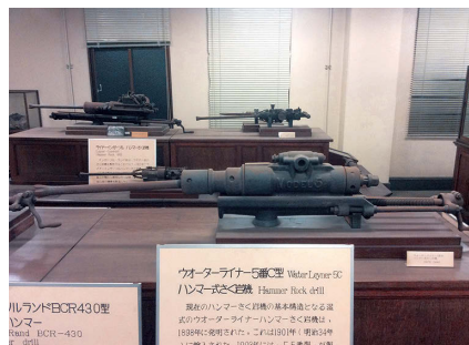
写真3) ウォーターライナー 5 番型ハンマー式削岩機