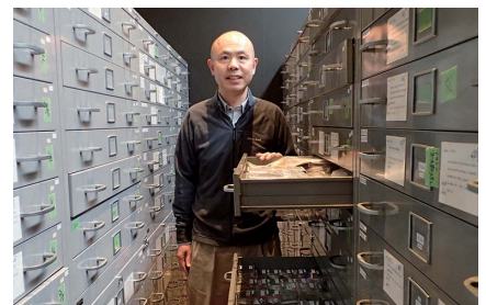
バックヤードに光を：東大標本室