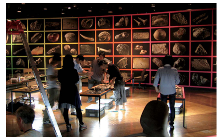
展示の準備は楽しい