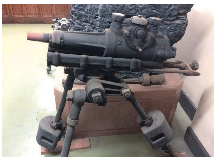
写真2) デマーク型衝撃式穿孔機