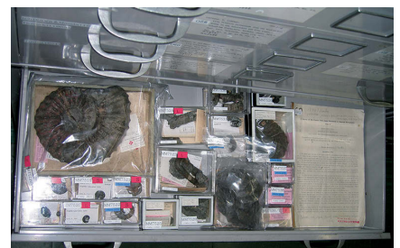
標本を大切に：神保(1894)記載標本