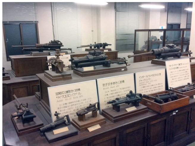
写真1) 列品室の削岩機コレクション

列品室の削岩機コレクションで最も古いものは、デマーク型衝撃式穿孔機であり、明治30年以前のものです。大型の据え置き式で三脚台に乗せて使用しました(写真2)。