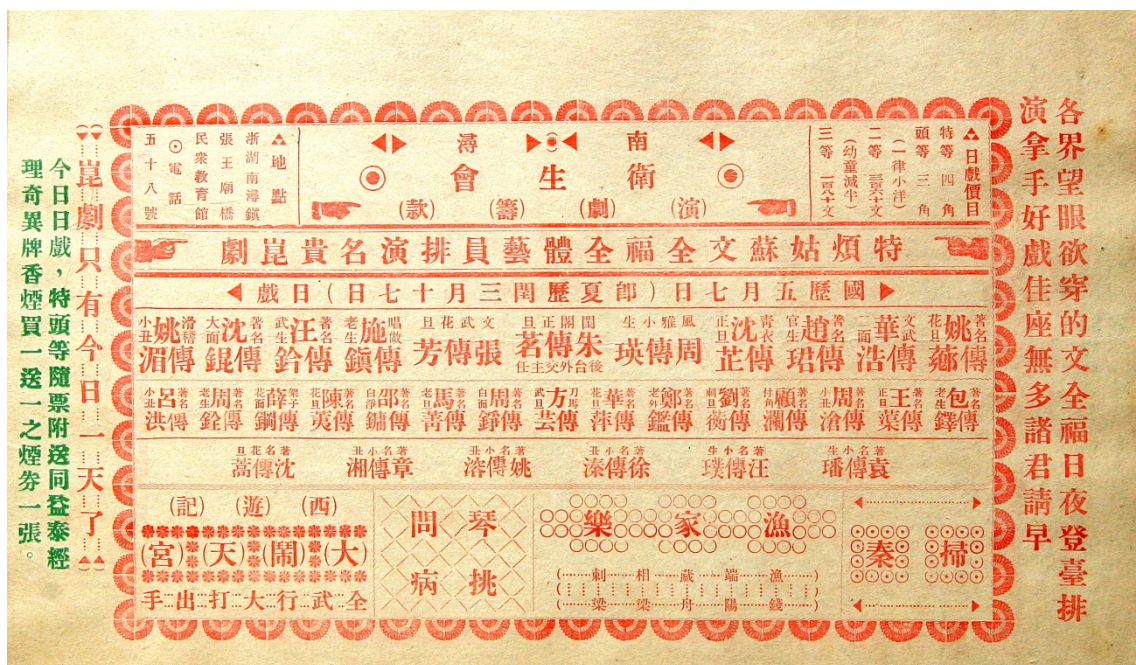
图10 1936年5月7日吴兴南浔镇张王庙桥民众教育馆，文全福演出戏单 九州大学图书馆滨文库所藏（滨文库/集181/51）21.9cm×37.1cm