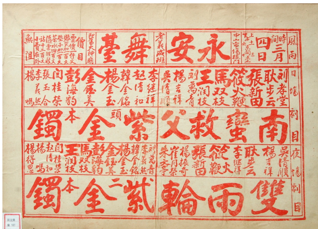
图8 1936年3月4日开封永安舞台戏单