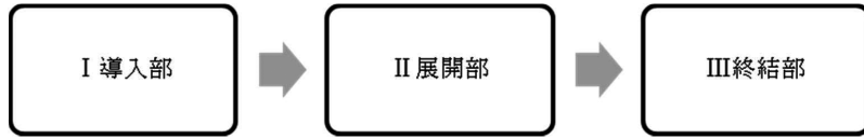
図1 本稿で分析する社説の構成部分

ここでは、市川（1978）の「内容の性質面から見た配列」及び長尾（1992）で挙げた「論理展開の型」を参照しつつ、新聞社説の論理展開の型を検討する。