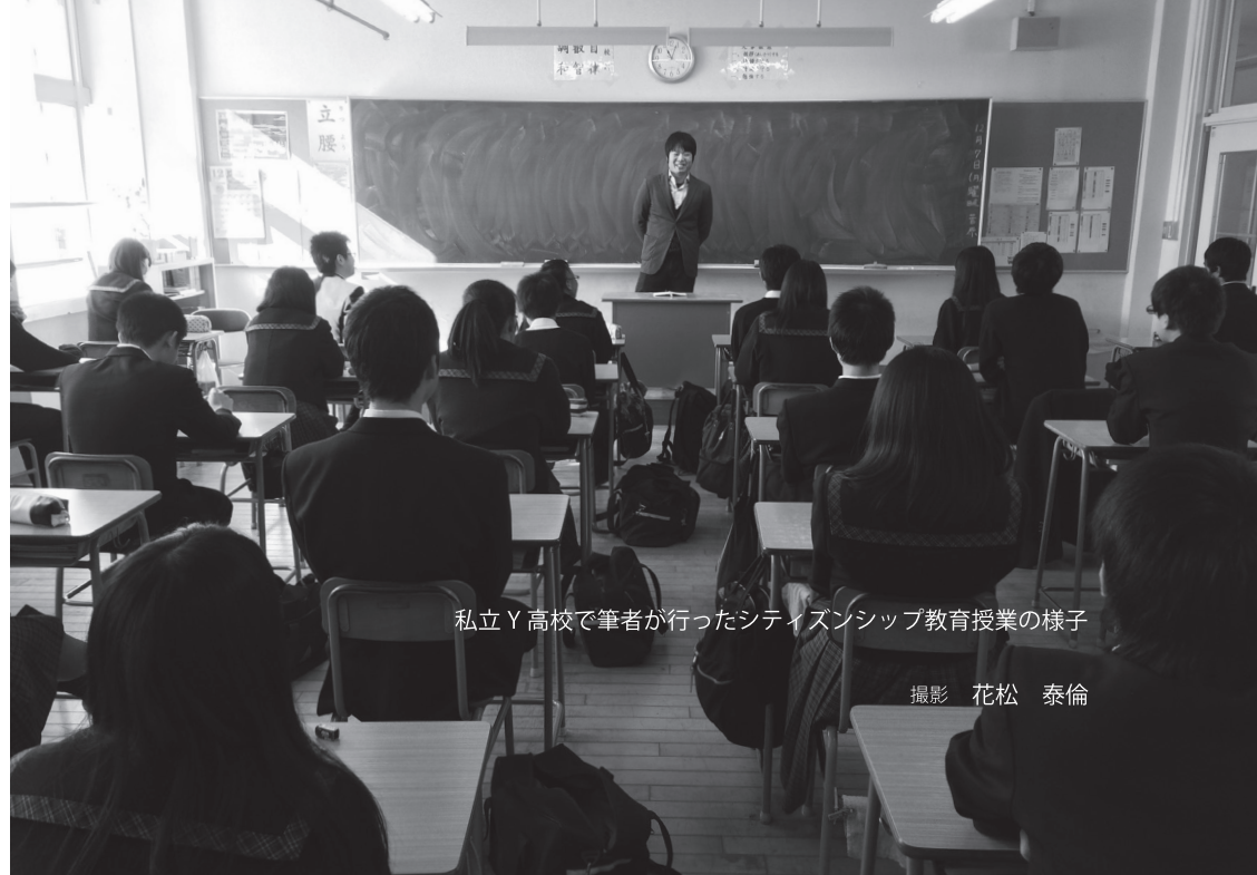
私立Y高校で筆者が行ったシティズンシップ教育授業の様子

まちづくり学習は、その名の通り、まちづくりを学ぶ学習である。筆者の目的は、まちづくり学習を通して、生徒に政治的調整の重要性を理解してもらい、社会を形成する一人前の大人に、また思慮ある行動のできる市民になる準備の機会を提供することにあった。 まちづくり学習では、生徒は学校の外に飛び出し、現実社会の中で政治的活動を学ぶ。たとえば、まちづくりに従事している地域住民に聞き取り調査を行ったり、多くの地域住民の前で将来のまちのあるべき姿について政策提言を発表したりする。生徒はまちづくり学習を通して、まちづくりに必要な能力、ひいては市民として身につけるべき政治的能力を獲得していく。 私立Y高校では授業後、生徒から、「授業をする前は、政治と聞いても、漠然としたイメージ（お金とか）しかなかったのですが、授業を通して、多くの人の意見をまとめ、より良い決断をすることだということがわかりました。」といった声が聞かれた。生徒は授業をとおして、第2決定フェーズの性質を理解し、その積極的な意義を見出すことができたといえるだろう。まちづくり学習を