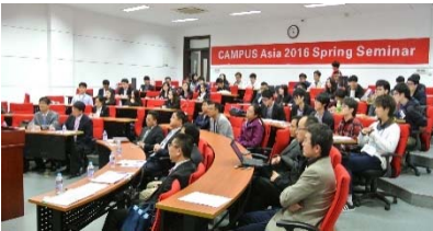
〈スプリングセミナー 上海交通大学 2016/4/26-4/28〉

◆スプリングセミナー(上海交通大学) 上海交通大学開学120周年の記念行事として開催されたスプリングセミナーへ参加。