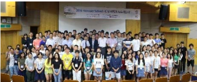
〈サマースクール 釜山大学校 2016/8/16~8/26〉

◆スプリングセミナー、校外学習(九州大学) キックオフシンポジウム終了後、水俣、鹿児島地方への校外学習を実施。2泊3日に亘り、エネルギー環境理工学に関する学習を実施。