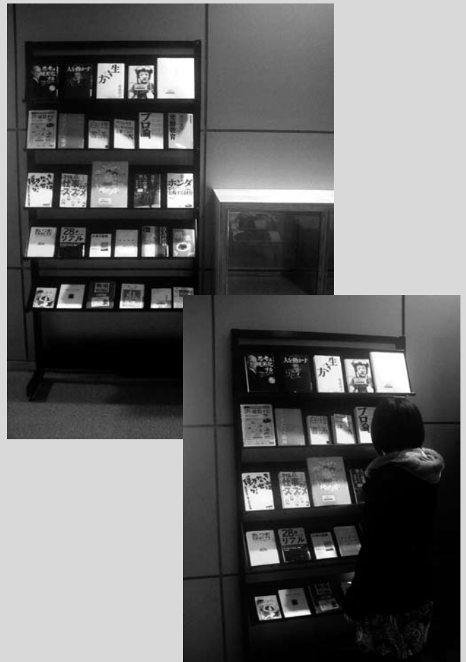
写真1 理系図書館の FYF 推薦図書コーナー

一般的な図書館のスタイルは、カテゴリ毎に整理されて整然と配架されていて、利用者が目的に合わせて探し出すイメージと言える。FYF 書籍コーナーもカテゴリ分けされている点では同様であるが、そのジャンルは「将来のことを考えるきっかけ」である。誰もが、悩み考えながら通過していく就職や将来のことをテーマにした本が並んでいる。これは、ジャンルとしては1つであるが、様々な分野の著者が連なり、幅広い視野と知見を私たちに与えてくれる。さらに、このジャンルは、学生が求めるものにマッチしたものである。つまり、図書館として能動的なコーナーを展開している新しいスタイルと言える。これが一つのきっかけとなり、今後も図書館側と学生側が協力して互いに価値を高め合うような新たな図書館の利用が展開していくことを願っている。