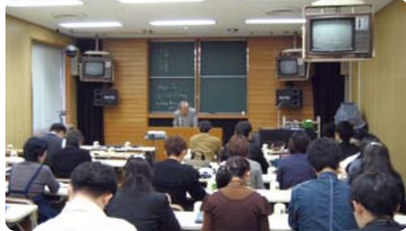
貴重文物講習会の様子(第2回 2007.11 於:六本松分館)

開催日の4日前までに、附属図書館コンテンツ整備課電子化係(db@lib.kyushu-u.ac.jp)にお知らせください。