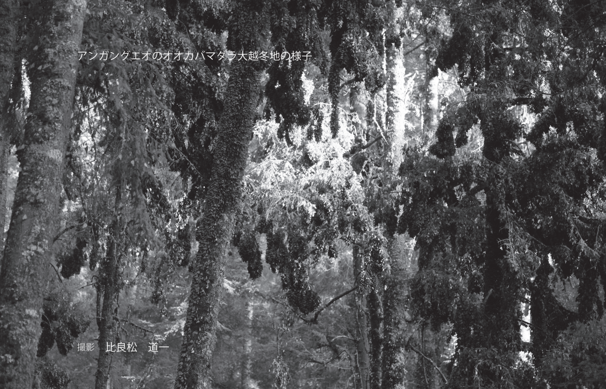
アンガンクエオのオオカバマダラ大越冬地の様子

オオカバマダラは比較的大型の蝶だ。オレンジ色を基調に、黒の縁取りのある羽は美しく、飛翔は優雅。この蝶の実物を見てもとても4500kmもの長旅ができる強靱な体を持っているとは思えない。