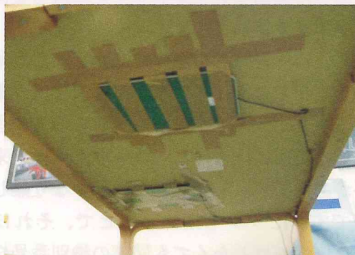
図5. インターネット検索・リーダー付き閲覧テーブル (福岡市あいれふ図書室)