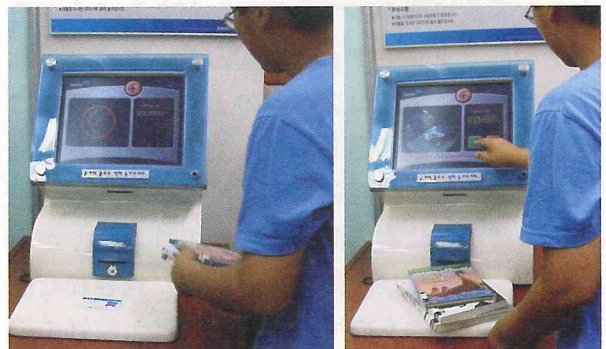
図1. 自動貸出機（議政府市図書館）

図1は児童図書室に設置してある自動貸出機の写真です。まず利用者カードを台に載せます（左）。その後、借りたい図書をその上に載せ、