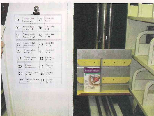
図2. 自動分類機 (Farmington 公共図書館)

タッチスクリーン上の貸出ボタンを押します。本図書館ではその後暗証番号の入力を求めることで利用者をダブルチェックしています。