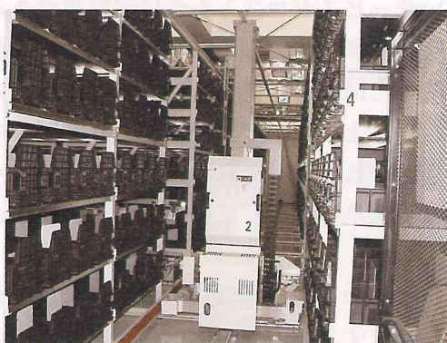
図4. 自動書庫 (九大筑紫分館)

現在はそれほど普及していない自動書庫ですが、将来的には図書管理のための省力化を図るために多くの図書館で利用されることと思います。現在、筑紫分館の本システムでは、図書の格納・取り出し時の識別番号読み出しをバーコードで行っています。近いうちにICタグを利用したシステムとする計画となっており、いっそう便利になることが期待されます。