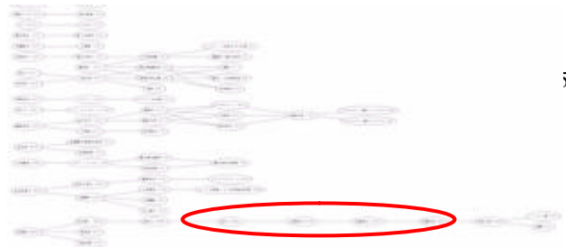
図 3：発明者と技術用語の概念グラフ（A 社） 印の箇所には、発明者名の間に「染色」「色調」といった用語が表示され「染毛剤」の開発者と予測可能 定量的解析ができておらず、今後の課題と考えている。