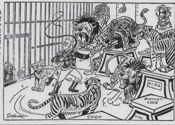
得意の猛獣使ひルースベルト