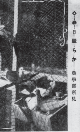
就職の保証を當局へ望む