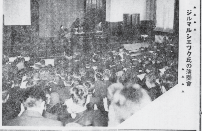
シエ氏シエ氏の演奏會

北九州市九大セツルメントは、創立五週年を迎へて、愈々活潑な活動を展開して來てゐる。